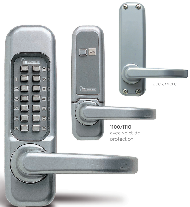
1100/1110 avec volet de protection