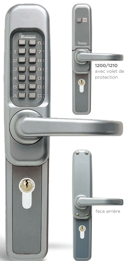
Garniture 1200 classique et avec volet de protection