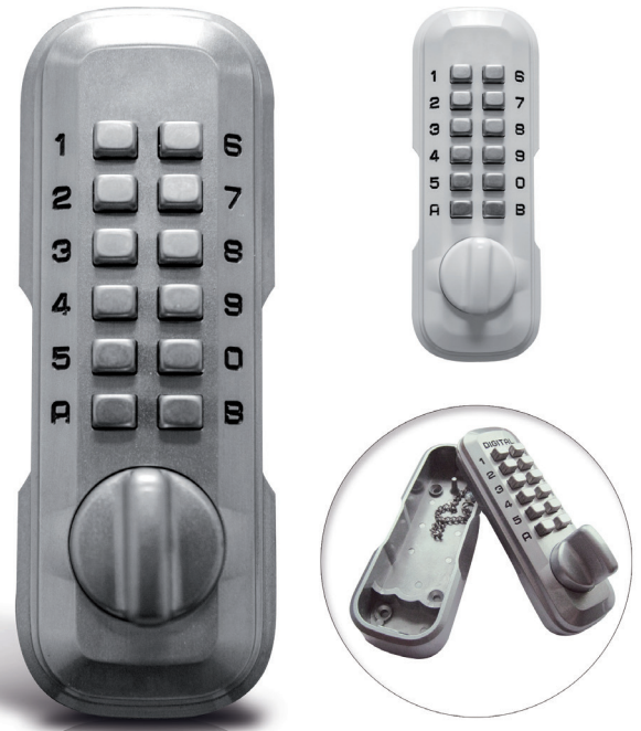
Boîte à clés 700 revêtement Alu. et blanc mat